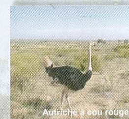
Autriche à cou rouge